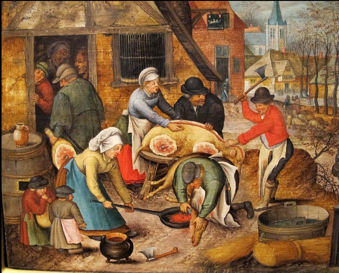
Paysans occupés à tuer le cochon, tableau de Pieter Brueghel le Jeune.