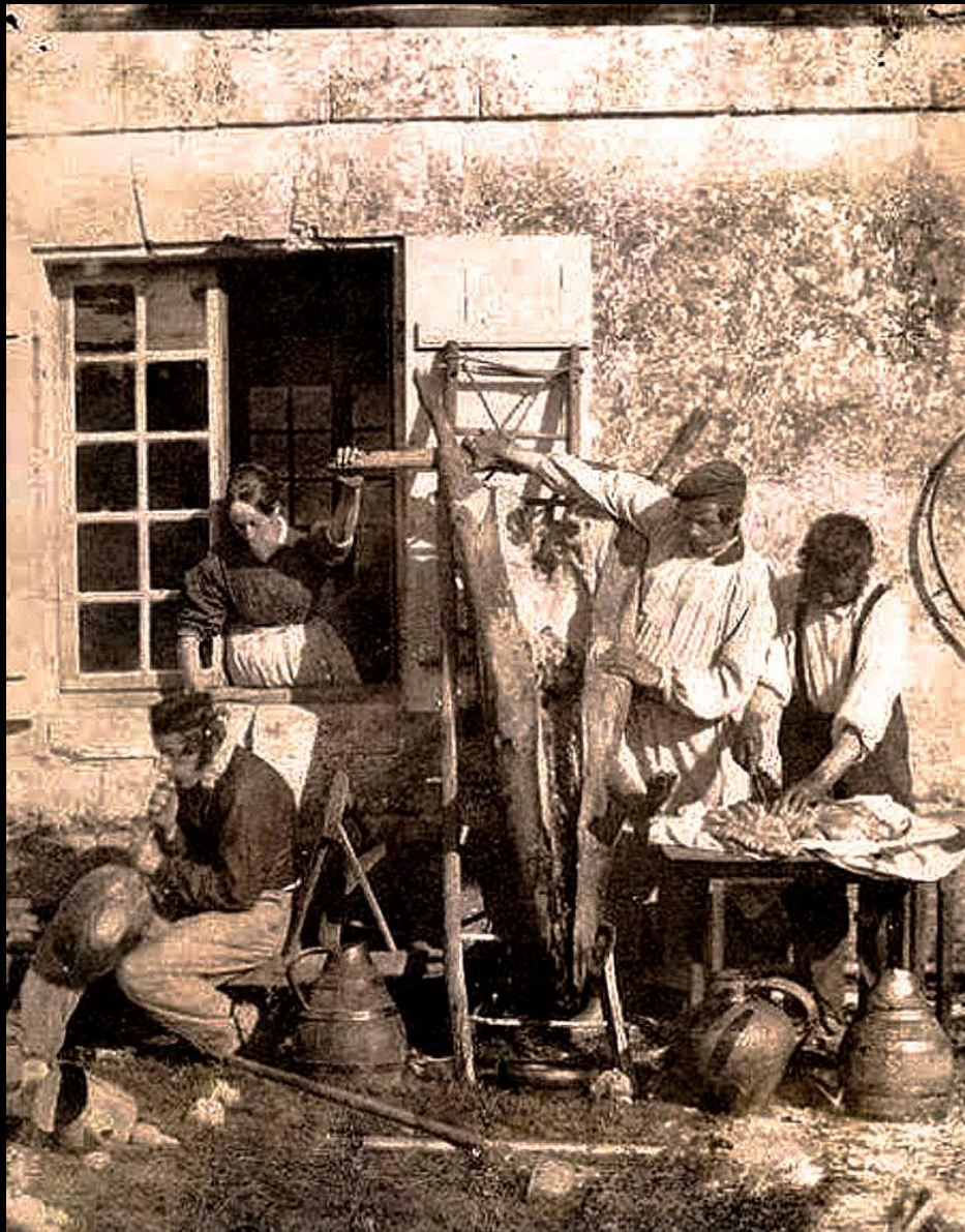
Le dépeçage du cochon en 1850, par Louis Adolphe Humbert de Molard.

Il fallait ensuite le porter sur le bûcher fait d'une dizaine de «clés» de paille, puis bien brûler toute la soie des 2 côtés. Il fallait ensuite le nettoyer proprement en raclant la peau car la couenne serait utilisée dans les «sacaris» : des saucissons faits avec un mélange d'abats et de viande. Puis on enlevait les «clapotes» : enveloppes du bout des pieds. Alors il fallait le vider, le découper en séparant jambons, épaules, côtes, pieds et tête que l'on mettait au «salou» ou saloir d'avec la viande et le lard destinés aux saucissons et des abats : foie, poumons, panse et boyaux. On préparait le sang pour les boudins avec des herbes et des épices sans oublier la crème pour les rendre plus onctueux. On lavait les boyaux, un travail pas très ragoutant : ils allaient servir pour faire les boudins avec le sang et les saucissons avec la viande et le lard. On remplissait de sang le boyau le plus long correspondant à l'intestin grêle pour le mettre à cuire dans la chaudière. On préparait ensuite la viande et le lard que l'on broyait au hachoir à manivelle : c'était le travail des enfants avant l'arrivée des moteurs.