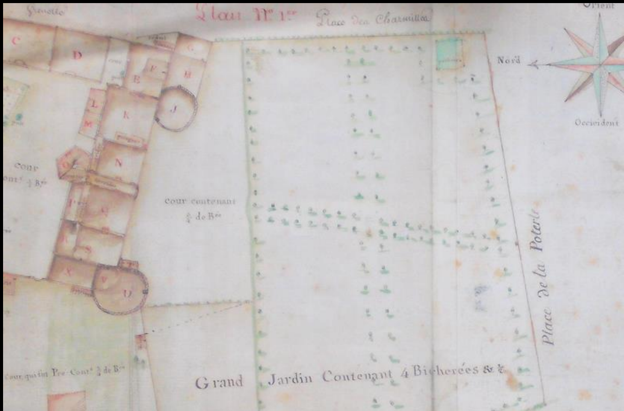
Relevé du plan de la Commanderie en 1798

Il nous faut donc résoudre un problème d'emplacement.